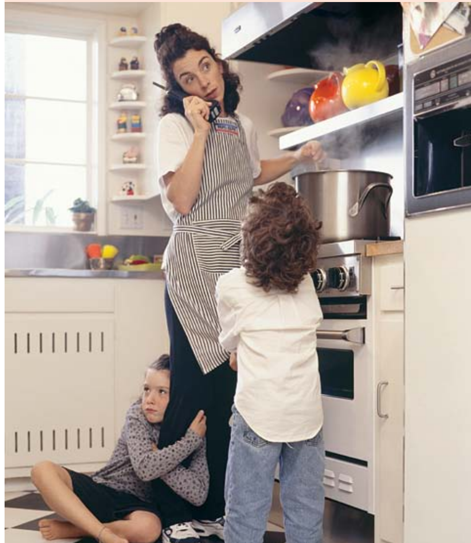
לגונב את לבה של אמה. צילום אילוסטרציה

באחד מסניפי רשת מזון גדולה הסתובבה אישה כשהיא דוחפת עגלת ובה תינוק שצווח ללא הפסקה. קב"ט חד'עין הבחין שמתחת לעגלה יש שטף קל של מים ורדרדים. הוא ניגש אל התינוק וגילה לתדהמתו שמתחתיו מוחבא גוש בשר קפוא שהחל להפשיר, והתינוק האומלל צורה מקור ומרטיבות