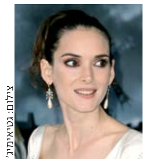
זה לא הכסף, טמבל. וינונה ריידר

או בולנו מועדים? "אני מאמינה שכן. בכל אדם קיים היצר הרע הזה". אם בכל זאת ננסה לתת בגנב סימנים, נגלה שרק מעטים מאוד מהגנבים שנתפסו במקום עבודתם עונים